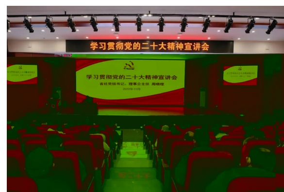
11月30 省 讲 精神 晓 来 湖南 精

务 好 往 努 沟通桥梁 注 呼 解 困难 依法 达 诉 据悉 2021 年 案 涉 均 相 收 22 利 施 均 相 部 牵 研 10 案 也将 逐 答 (通讯 易婧